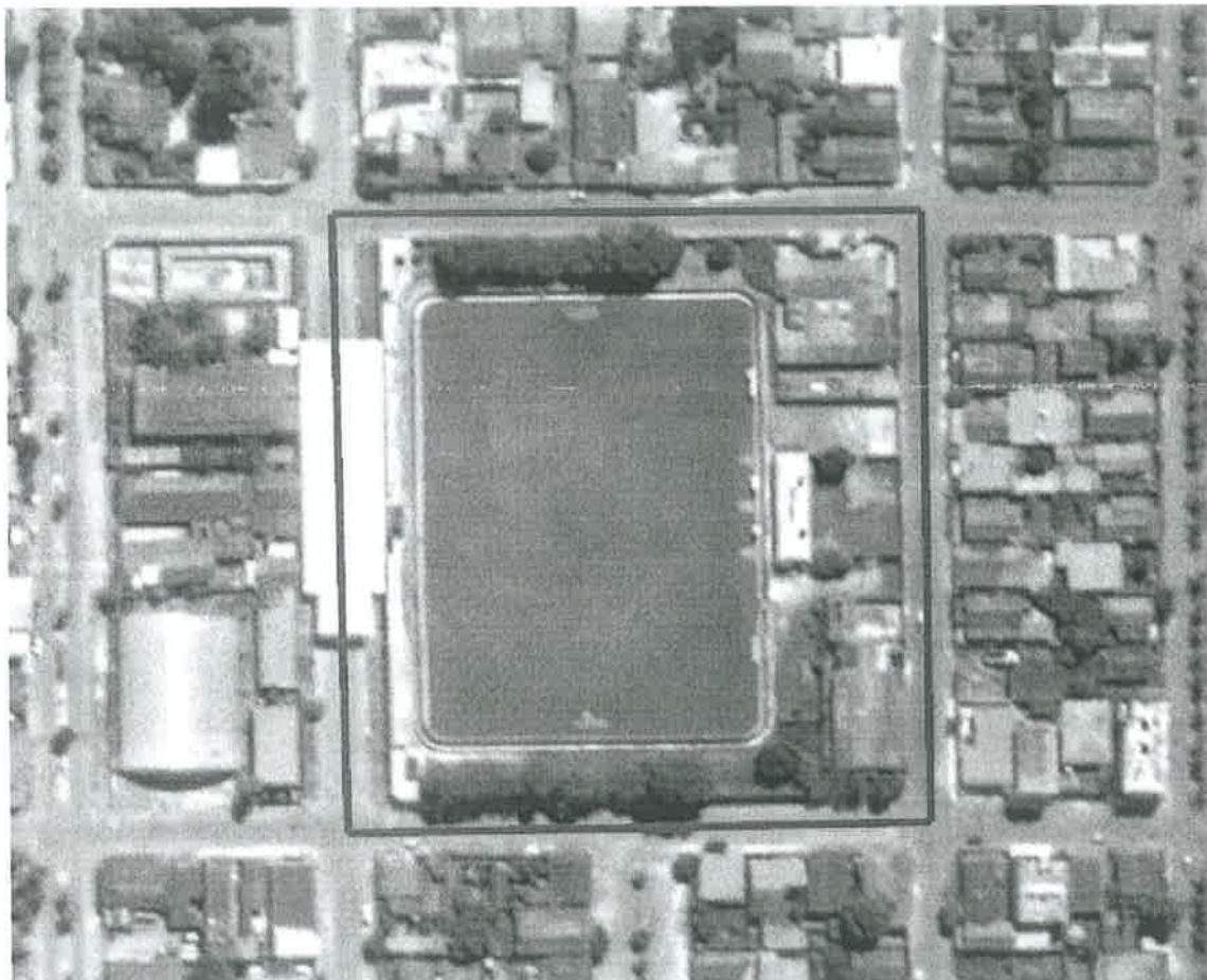
Figura 1 – Estádio Municipal