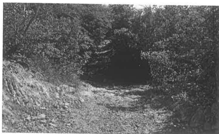
Figura 4 - Foto do local de implantação da Ponte sobre o Córrego Cristalino

Ouvidor – Goiás, 30 de novembro de 2020.