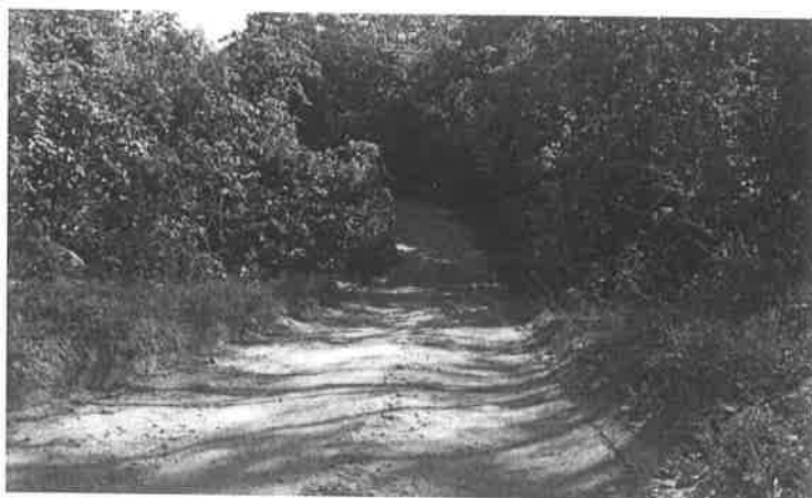
Figura 1- Ponte que será desativada devido a alteração do traçado da estrada e estado precário de conservação.