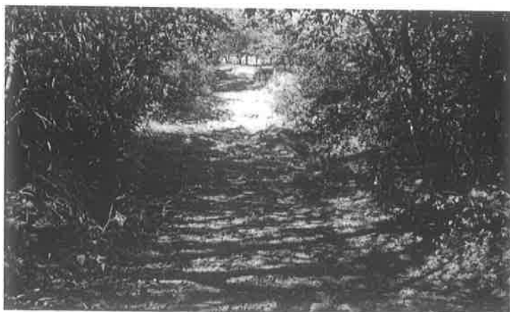
Figura 2 - Foto do local de implantação da Ponte sobre o Córrego Cristalino