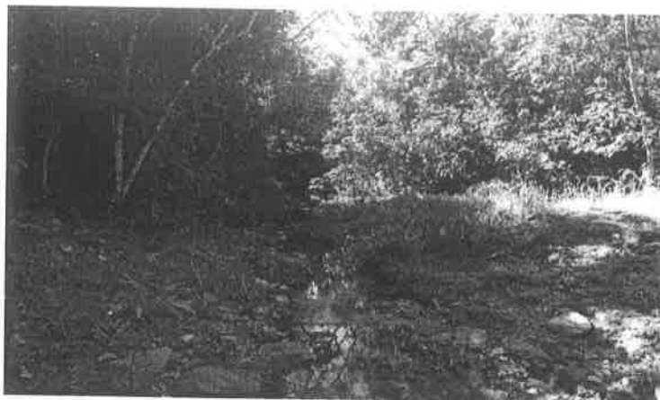
Figura 3 - Foto do local de implantação da Ponte sobre o Córrego Cristalino