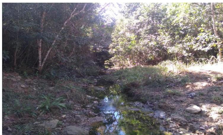
Figura 3 - Foto do local de implantação da Ponte sobre o Córrego Cristalino