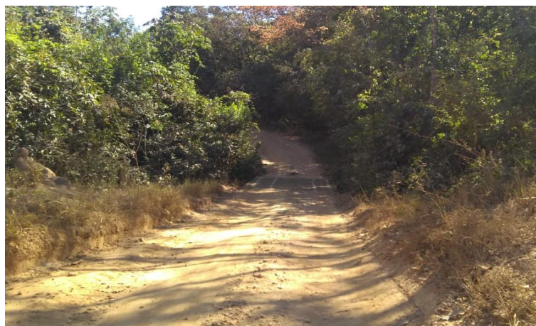
Figura 1- Ponte que será desativada devido a alteração do traçado da estrada e estado precário de conservação.