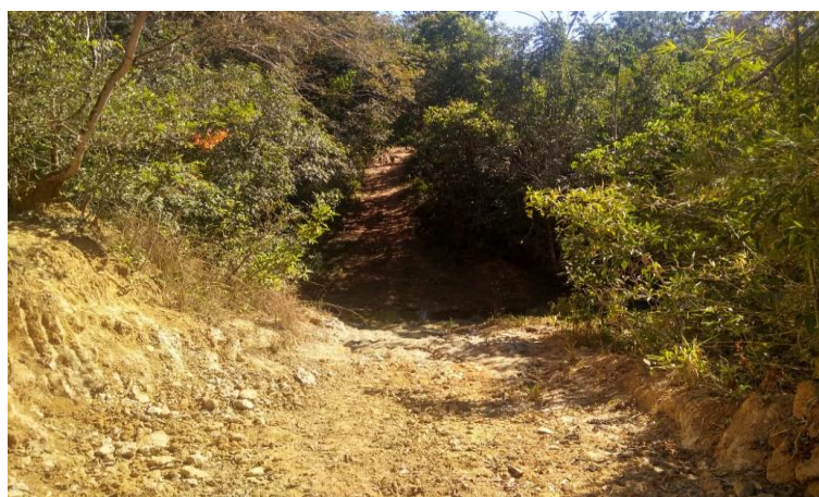
Figura 4 - Foto do local de implantação da Ponte sobre o Córrego Cristalino

Ouvidor – Goiás, 30 de novembro de 2020.