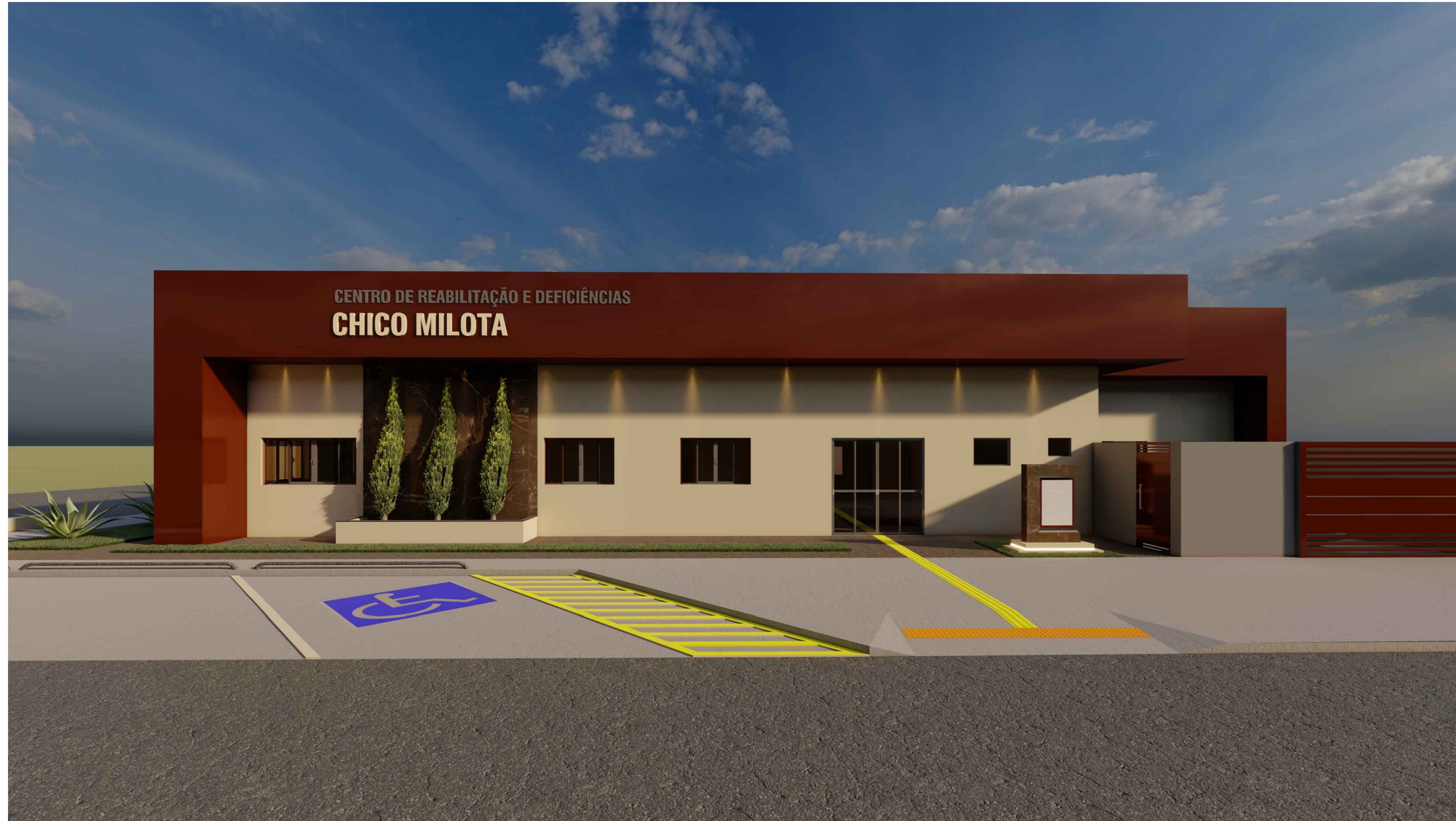
VISTA - A