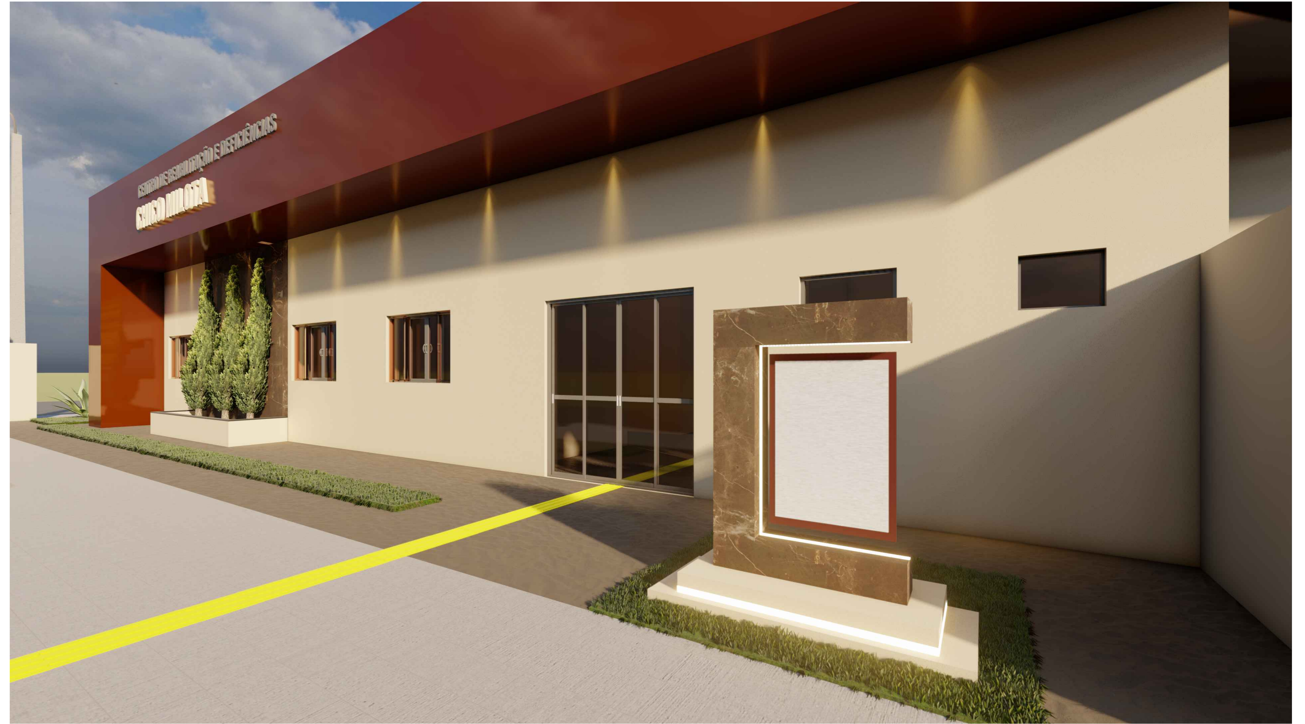
VISTA - C