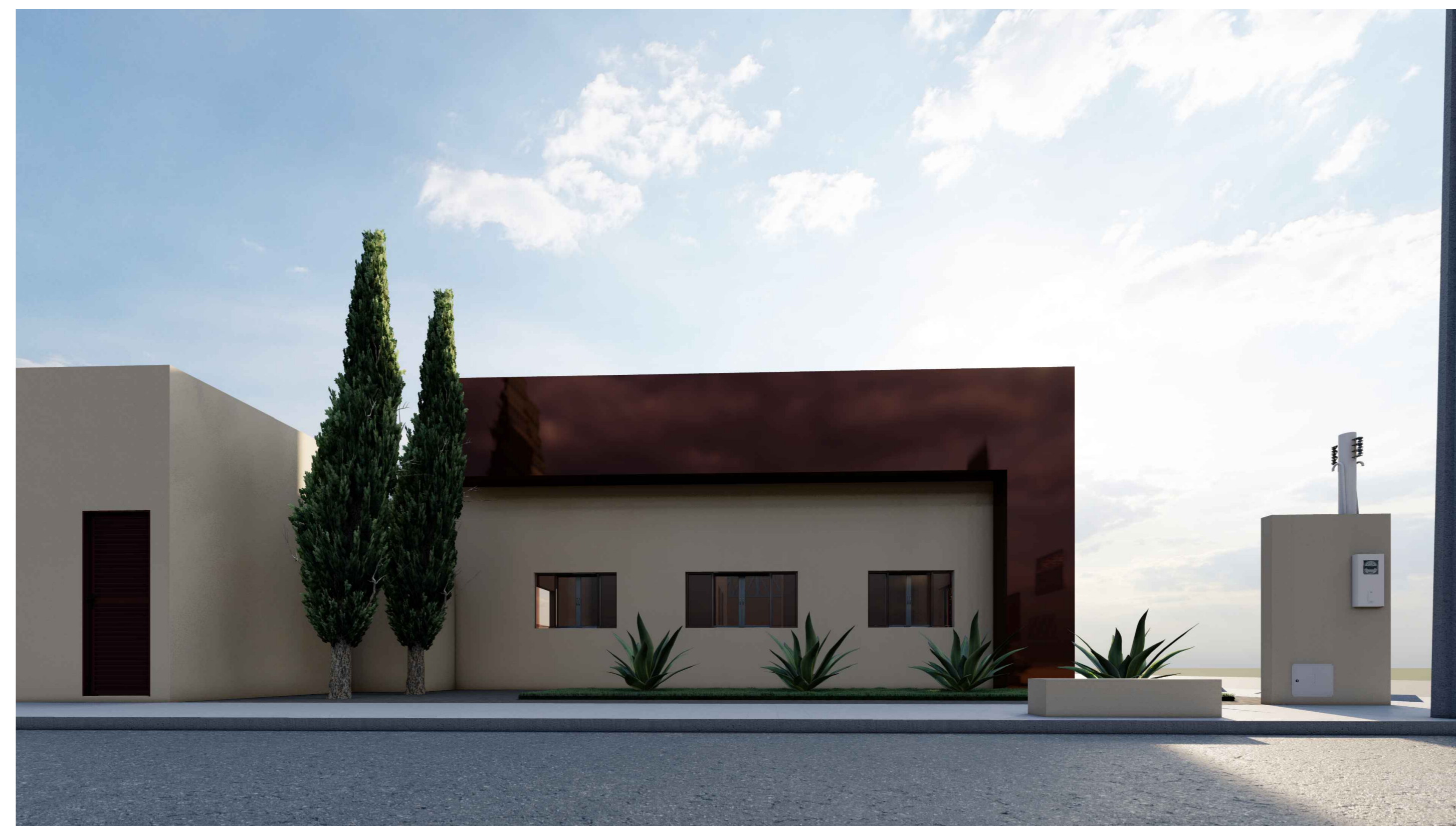
VISTA - D