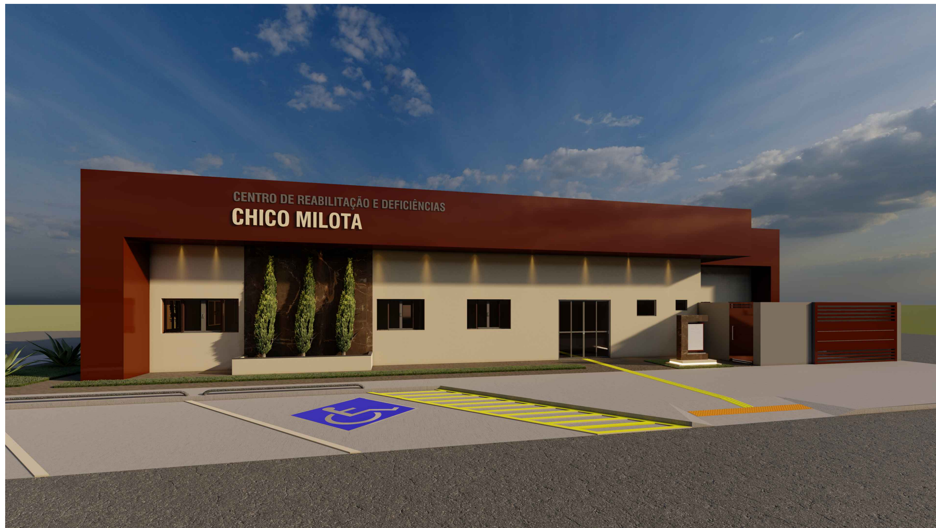
VISTA - B